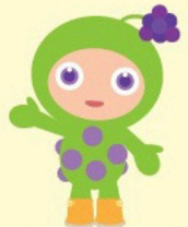
イクサカカットPRキャラクター 「カラットリン」