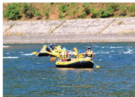
【 B 】