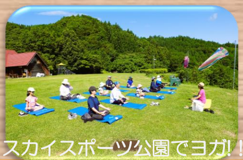
スカイスポーツ公園でヨガ!