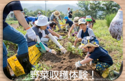
野菜収穫体験! やまなみ荘へのアクセス