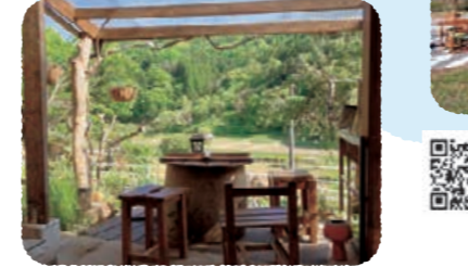
カフェ猫のあくび

▲自然派食品・生活雑貨などの販売店舗と、1棟貸しのゲストハウス(自炊型)。ペット同伴宿泊も可能です。ゲストハウス・インラケツチ：MAP ①