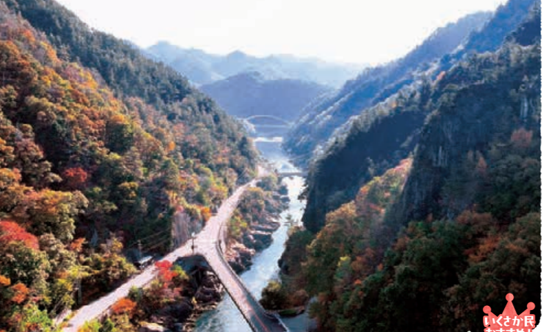
長野自然100選にも選ばれた景勝地、山清路の景色。山清路：MAP ①