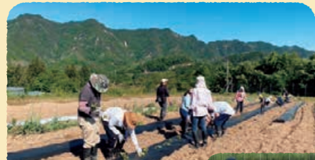
農業体験ツアー (春・夏・秋)