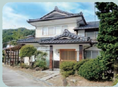
生坂村移住者田舎体験ハウス: MAP 6

生坂村では最長1か月の田舎暮らしを体験することにより、実際の移住に近いイメージを感じることができます。さらに生活に必要な設備をご用意し、あなたのプレ田舎暮らしをサポートします。詳しくは村ホームページ、または下記までお問い合わせください。