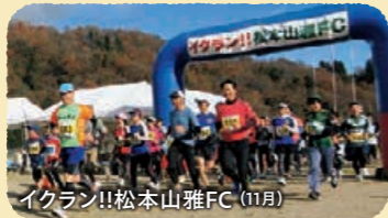
イクラン!! 松本山雅FC (11月)